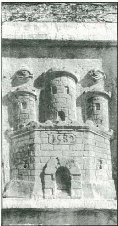
Escudo de la Villa de Ulldecona

Y pensar que haya habido que esperar 150 años desde que el latrocinio de Mendizabal (1835) privó a Ulldecona del Castillo y que encima ha habido que pagar cinco millones de pesetas. Para ponerse a llorar porque lo comprendo, un campo de desolación fue la «Ulldecona Vella». Allí en el entorno de una Iglesia profanada, del Torreón de Guingstan (1212 años de centinela alerta) y la Torre Templaria que se tiene en pie por milagro, es donde deben yacer las cenizas de los antepasados. De ellos habla 21 «Llibre de Privilegis». Allí se cerró el capítulo de la dominación árabe en Cataluña y se puso coto a la piratería.