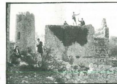
Estado ruinoso del Castillo